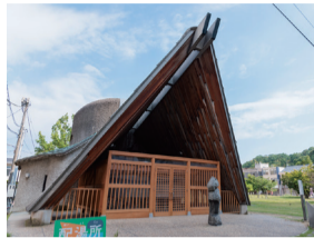
片山津溫泉配湯所

中谷宇吉郎博士出身於片山津，是首位製造出人工雪的科學家。在此館可認識博士豐碩的研究成果。