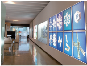
中谷宇吉郎 雪的科學館

中谷宇吉郎博士出身於片山津，是首位製造出人工雪的科學家。在此館可認識博士豐碩的研究成果。